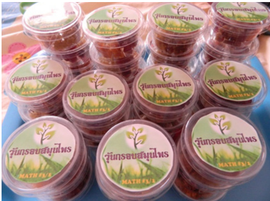
ภาพที่ 1 ออกแบบโลโก้ผลิตภัณฑ์ และการเลือกใช้บรรจุภัณฑ์

การจัดกิจกรรมการทำวันกรอบสมุนไพร อาจใช้เวลานานในการจัดกิจกรรม แต่เป็นรูปแบบการเรียนการสอนที่กระตุ้นให้ผู้เรียนได้ฝึกการแก้ปัญหา กระตุ้นให้ผู้เรียนได้คิด แสดงความสามารถที่หลากหลาย อีกทั้งผู้สอนยังสามารถนำไปพัฒนาทักษะด้านอื่นๆ ได้อีก