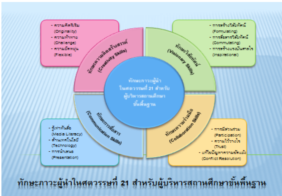
ภาพที่ 2 กรอบแนวคิดระดับองค์ประกอบหลัก องค์ประกอบย่อยของโมเดลความสัมพันธ์เชิงโครงสร้างตัวบ่งชี้ ทักษะภาวะผู้นำในศตวรรษที่ 21 สำหรับผู้บริหารสถานศึกษาชั้นพื้นฐาน

ส่งผลถึงคุณภาพการศึกษาไทยในอนาคต โดยมี กรอบแนวคิดในระดับองค์ประกอบหลัก และองค์ ประกอบย่อย แสดงดังภาพที่ 2