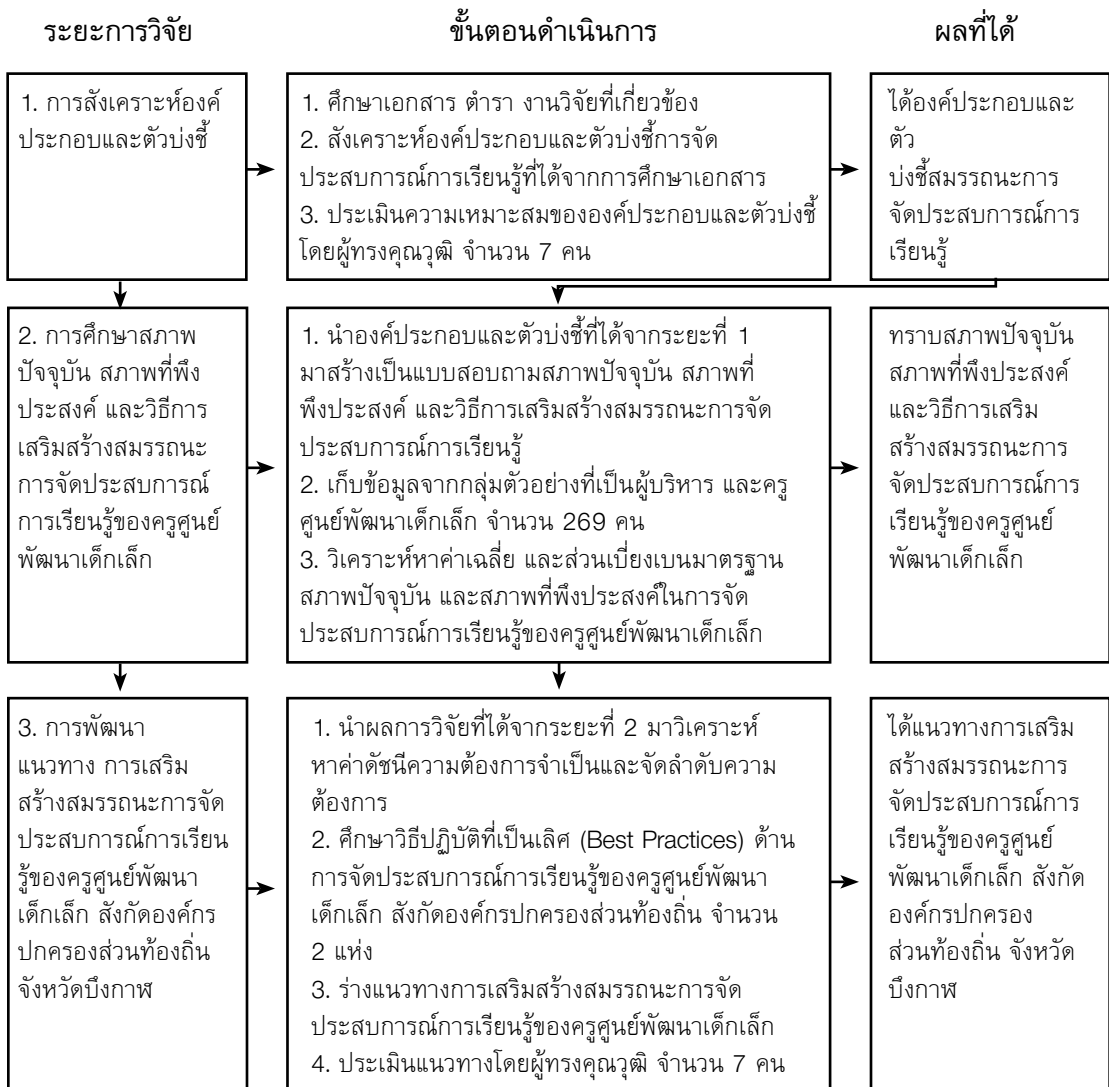
ภาพที่ 2 ระยะการวิจัย ขั้นตอนการดำเนินการ และผลที่ได้

ระยะที่ 3 การพัฒนาแนวทางการเสริมสร้างสมรรถนะการจัดประสบการณ์การเรียนรู้ของครูศูนย์พัฒนาเด็กเล็ก สังกัดองค์กรปกครองส่วนท้องถิ่น จังหวัดบึงกาฬ