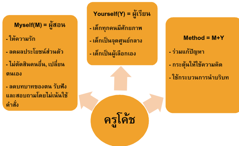
ภาพประกอบ 1 ทักษะของครูโค้ช

จากภาพประกอบ 1 สรุปได้ว่า ทักษะของครูโค้ช จะประกอบด้วยปัจจัยที่สำคัญ 3 ประการ ดังนี้